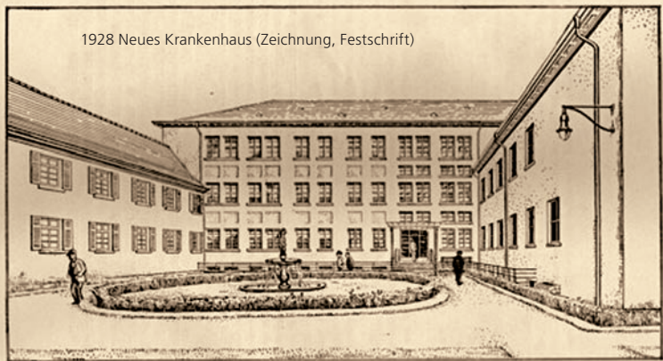
1928 Neues Krankenhaus (Zeichnung, Festschrift)

Es wurden Räume für zunächst 140 Betten geschaffen, die später auf 240 erweitert wurden. Die Krankenzimmer sind sämtlich in langer Front nach Süden zum Rhein hin gelegen, um „Licht, Luft und Sonne als natürliche Heilmittel“ – wie geschrieben wurde – zu berücksichtigen. Die Funktionsräume, Operations- und Röntgenabteilung waren in dem nördlich gelegenen Gebäudeteil untergebracht. Das 1884 geschaffene Nebengebäude südlich des ehemaligen Klosters wurde abgebrochen. Im Jahre 1928 standen 1 Leitender Arzt, 2 Assistenzärzte, 12 Ordensschwestern, 9 Hausmädchen und 1 Krankenwärter zur Verfügung. Im Jahr 1929 wurden 1946 Patienten stationär behandelt.