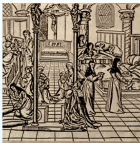
Krankensaal in einem großen Hospital (Holzschnitt um 1520)

1417 Am Rheinufer am Unteren Tor (heute Rheinstraße 55) wurde der Spitalbau errichtet. Ursprünglich handelte es sich um ein relativ großes mehrstöckiges steinernes Gebäude mit verschiedenen Nebenbauten, gewölbten Kellern und einem Garten. Zentraler Raum war der sogenannte „Armensaal“, in dem wahrscheinlich 12 (oder 24?) Betten Platz fanden. Außerdem wurde ein vierstöckiger Spitalbau für den Spitalmeister und die Pfründner errichtet. Überwiegend war das Spital eine Armen- und Altenpflegestation.