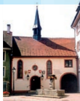
Renovierte Spitalkapelle 1985

1985 Weihe der vollständig restaurierten alten Spitalkapelle. Durch sehr viel Eigeninitiative hatten die Ehemaligen der Junggesellschaft 1468 Waldshut dieses Baudenkmal bewahrt und der Öffentlichkeit zugänglich gemacht.