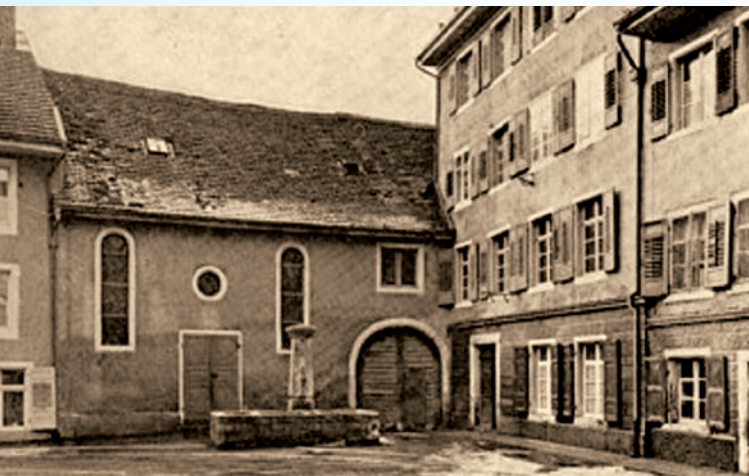
Alte Spitalkapelle, Rheinstraße

1422 Als Ausdruck der Verbundenheit mit der Kirche, wurde vom Rat der Stadt innerhalb des Spitalanwesens ein Altar im Armensaal sowie eine Kapelle gestiftet.